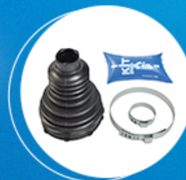
Homocinética: Kit coifa homocinética lado câmbio (trizeta) Cód: 50886