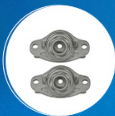
Suspensão: Kit coxins amortecedor traseiro Cód: 40665