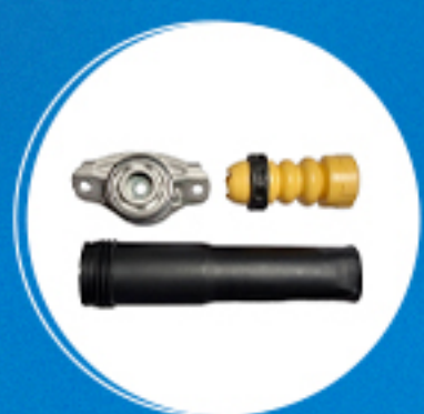
Suspensão: Kit amortecedor traseiro completo Cód: 40721