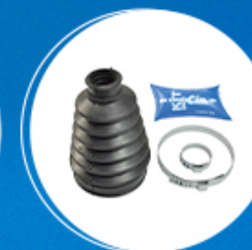
Freio: Kit coifa homocinética lado roda Cód: 40230