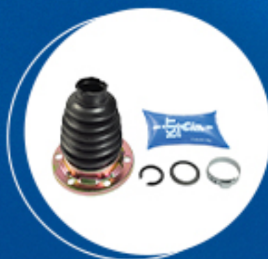
Homocinética: Kit coifa homocinética lado câmbio Cód: 40231