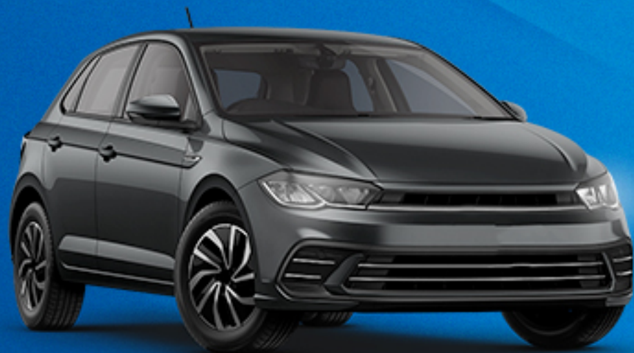
VOLKSVAGEN Novo Polo