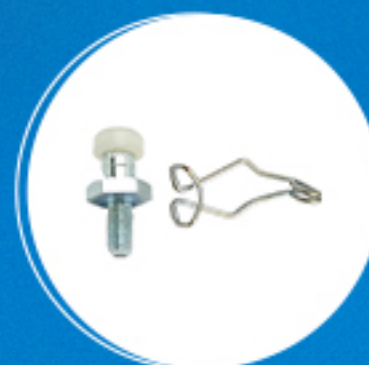
Freio: Kit pino esférico garfo de embreagem Cód: 15177