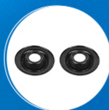
Suspensão: Kit prato superior mola amortecedor dianteiro Cód: 40670