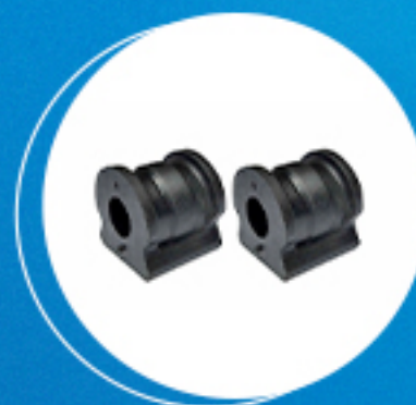
Suspensão: Kit buchas estabilizador dianteiro (furo 18mm) Cód: 40700