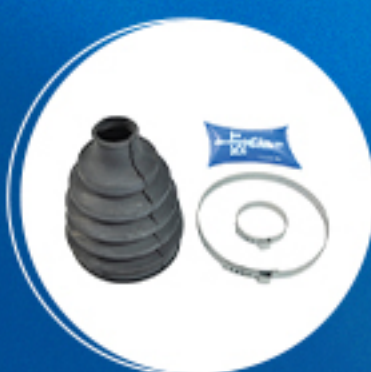
Homocinética: Kit coifa homocinética lado roda Cód: 40264