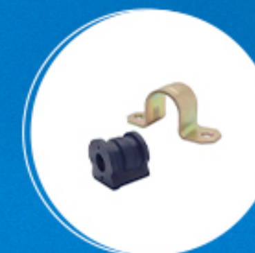
Suspensão: Kit estabilizador dianteiro (furo 18mm) Cód: 40127