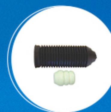
Suspensão: Kit amortecedor dianteiro Cód: 41268