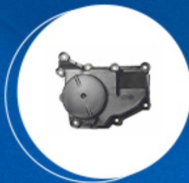
Motor: Kit anti-chama do motor Cód: 40699