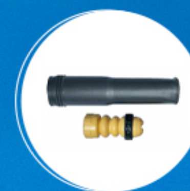
Suspensão: Kit amortecedor traseiro Cód: 40720