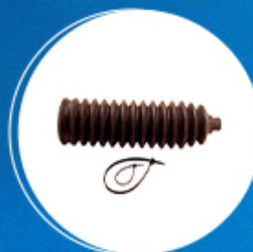
Direção: Kit coifa caixa de direção elétrica Cód: 40103