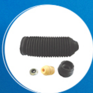
Suspensão: Kit amortecedor dianteiro completo Cód: 40501