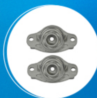
Suspensão: Kit coxins amortecedor traseiro Cód: 40665