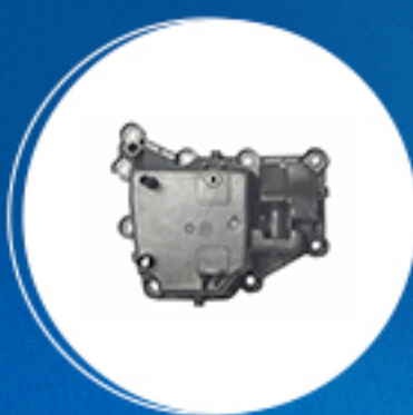
Motor: Kit anti-chama do motor Cód: 40698