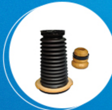
Suspensão: Kit amortecedor dianteiro Cód: 50759