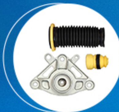
Suspensão: Kit pino guia dapiça dianteira Cód: 50806