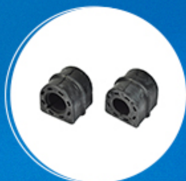
Suspensão: Bieleta estabilizador traseiro Cód: 50888