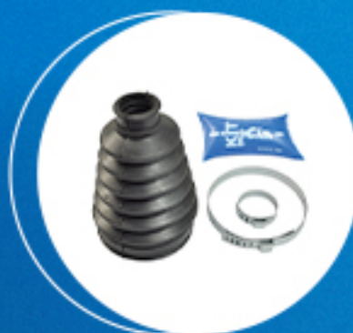
Homocinética: Kit coifa homocinética lado roda (4x2) Cód: 50746