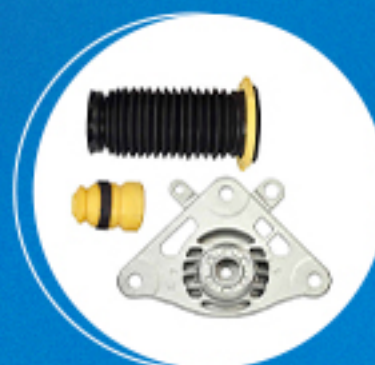
Suspensão: Kit amortecedor traseiro esquerdo completo Cód: 50807