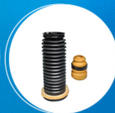
Suspensão: Kit amortecedor traseiro Cód: 50760