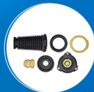
Suspensão: Kit amortecedor dianteiro completo Cód: 50805