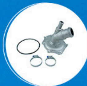
Motor: Kit tampa bomba d'água Cód: 10856