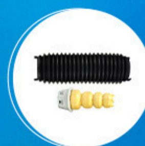
Suspensão: Kit amortecedor traseiro Cód: 10871