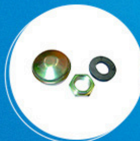
Roda: Kit calota roda traseira Cód: 10492