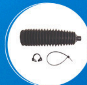
Direção: Kit coifa caixa de direção elétrica Cód: 10625