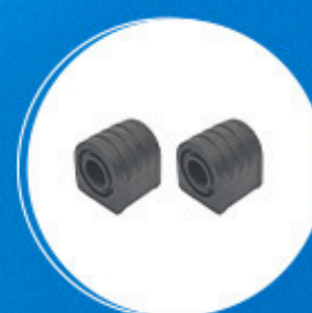
Suspensão: Kit buchas estabilizador dianteiro Cód: 10886