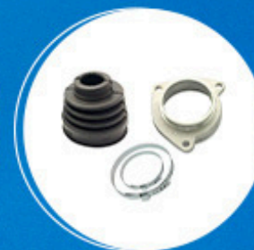
Homocinética: Kit coifa lado câmbio com flange Cód: 10053