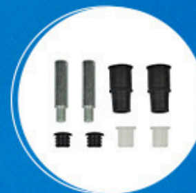
Freio: Kit pino guia da pinça dianteira Cód: 15400