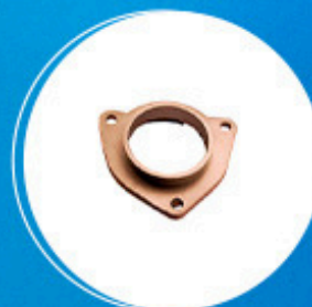
Câmbio: Kit adaptador do câmbio Cód: 10022